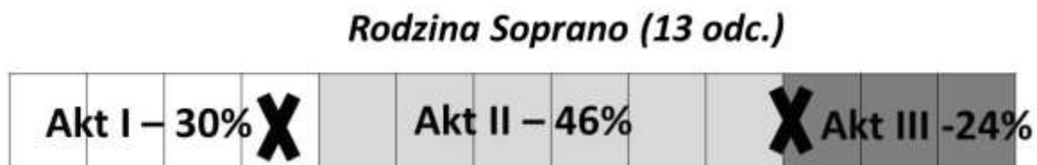
Rysunek 3 Przebieg dramaturgiczny głównego wątku pierwszego sezonu Rodziny Soprano

Poniższy diagram ilustruje rozkład wątku głównego w pierwszym sezonie